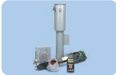
Thermo Scientific LevelPRO

un ciclo a otro, es necesario corregir la densidad del vapor para mantener la precisión de 0,5% del nivel gamma continuo. El medidor de densidad nuclear DensityPRO realiza este cálculo de equilibrio de masas y también utiliza la misma fuente gamma que el LevelPRO para minimizar el número de fuentes necesarias. Diseñados específicamente para controlar operaciones del tambor de coque, nuestros dispositivos garantizan el máximo control de los procesos a la vez que reducen el consumo de antiespumante y eliminan costosas condiciones de exceso de espuma.