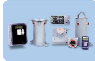
Thermo Scientific DensityPRO