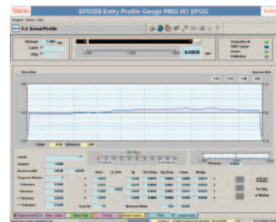
Экран оператора RM 215 HM с поперечным профилем толщины полосы

Обратная связь для САР обеспечивается толщиномером №1, тогда как толщиномер №2 обеспечивает расчет данных по «чечевицы», клиновидности и профилю, используемых для четкого графического отображение четырех последних сканирований профиля. Дополнительные данные по средней температуре и профилям толщины, а также расширенное отображение кромки полосы могут быть представлены на большом цветном мониторе.